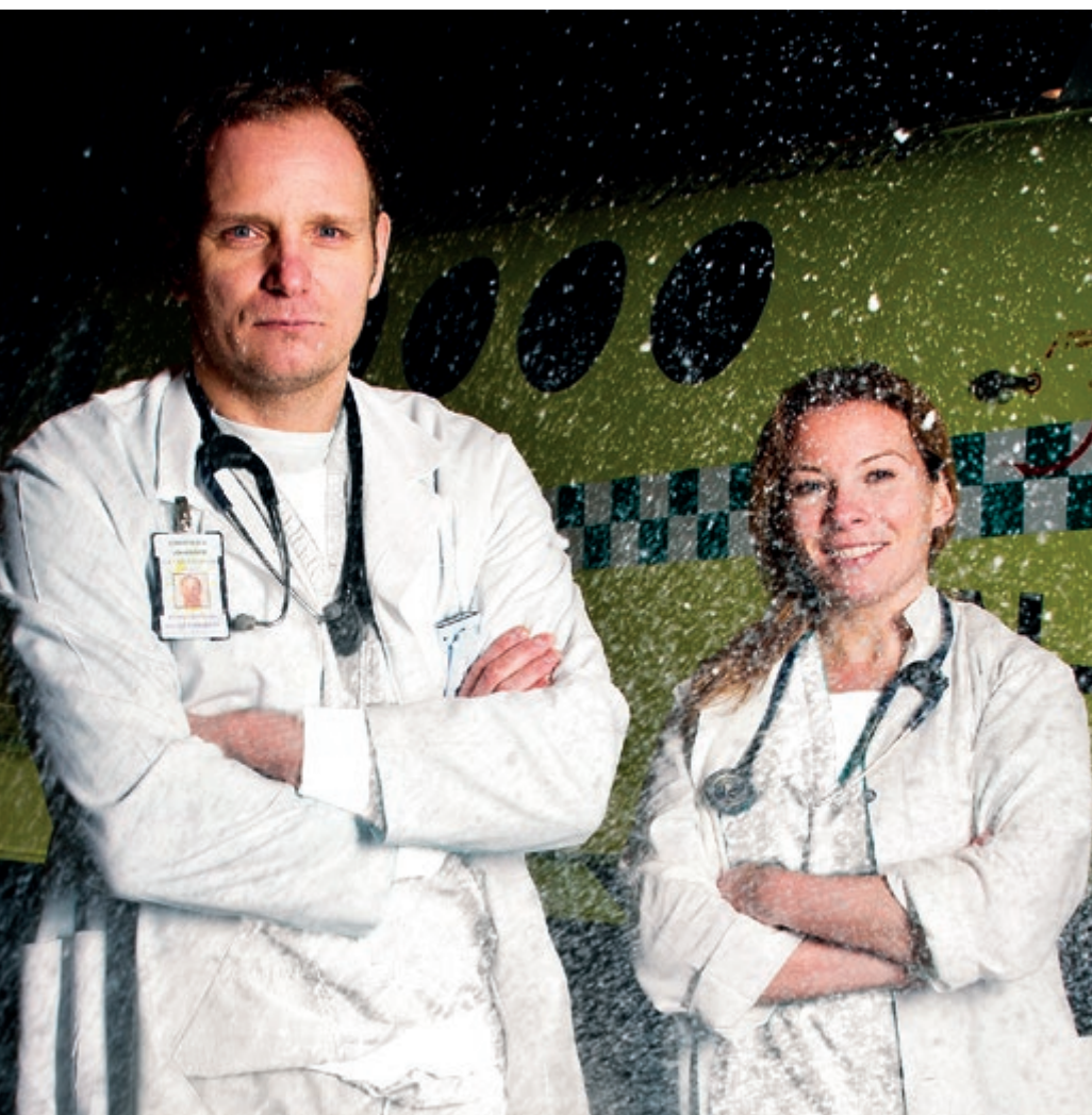
Leger i snøstorm med flyambulanse.

Ontario har dessuten flere likhetstrekk med lange avstander, et tøft klima og en flerkulturell pasientgruppe. Studieplanen ved NOSM er spesialutviklet i samarbeid med lokalbefolkningen for å imøtekomme deres sammensatte behov. Det planlagte undervisningstilbudet i Finnmark vil få et særskilt fokus på akuttmedisin, samhandling og kulturforståelse slik at legestudentene utdannes til å håndtere disse faktorene på en trygg og forsvarlig måte. I akuttmedisin skal BEST-konseptet (Bedre systematisk team trening) videreutvikles til studentBEST. Simulering og trening av hvordan man takler akutte situasjoner er typisk eksempel på at tverrprofesjonell undervisning er viktig.