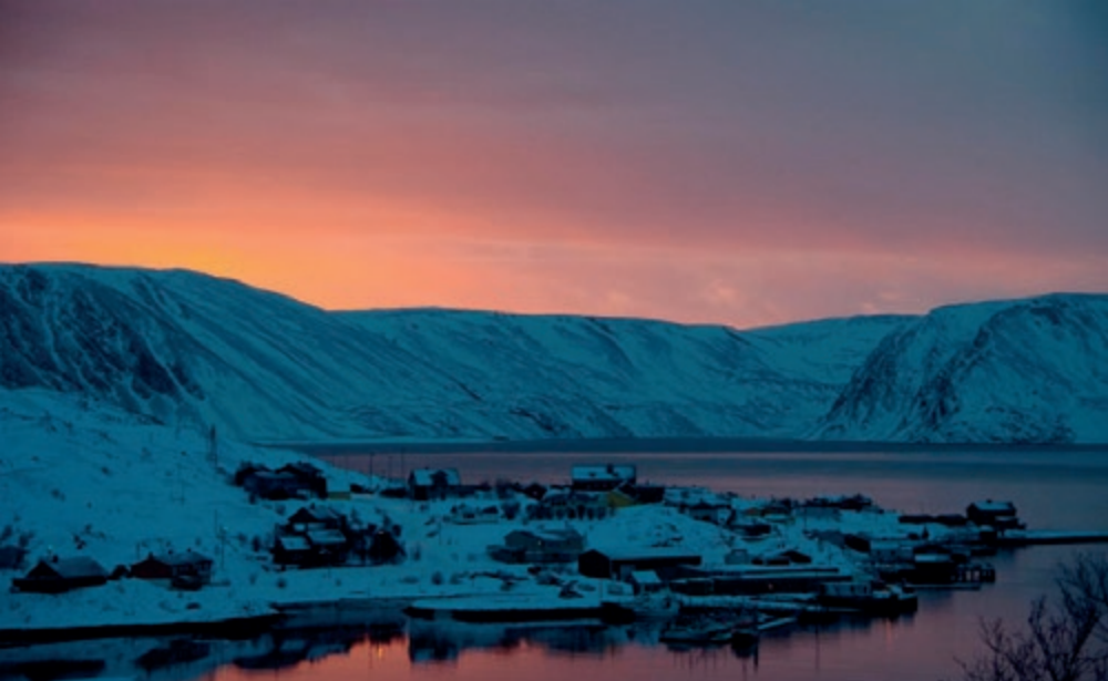
Legene i Finnmark er vant til mye ambulering og lange avstander. Dette er noe som gjenspeiles i undervisningsopplegget for legestudentene.

listhelsetjenesten der studentene skal følge hele pasientforløpet. Tre uker skal tilbringes i kommunehelsetjenesten og tre uker på Spesialistpoliklinikken. I Karasjok ligger SANKS (Samisk nasjonalt kompetansesenter for psykisk helsevern og rus) som har et nasjonalt ansvar for å tilby og utvikle helsetjenester til den samiske befolkningen. SANKS har et sterkt fagmiljø der sju ansatte har PhD-grad. Parallelt med utviklingen av Finnmarksmodellen arbeider Finnmarkssykehuset med store nybyggprosjekter i Alta, Karasjok, Kirkenes og Hammerfest. Areal til studentundervisning kan derfor fint planlegges inn i disse byggene.