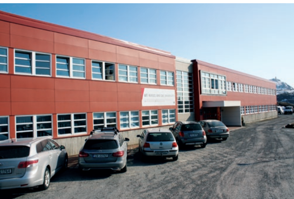
Campus Hammerfest huser i dag sykepleiestudentene og har gode fasiliteter, blant annet simuleringsrom.

Allerede fra høsten av håper UiT å være i gang med oppbyggingen av studietilbudet der første- til fjerdeårs-studenter skal bli kjent med undervisningsressurser og mentorer fra Finnmark som de vil kunne møte igjen på femte- og sjeteteåret hvis de velger Finnmarksmodellen. Fagmiljøet i Finnmark skal derfor tidlig inn i utdanningsløpet og framstå som inspirerende rollemodeller. Tidlig eksponering for helsetjenesten i Finnmark vil være et rekrutte-