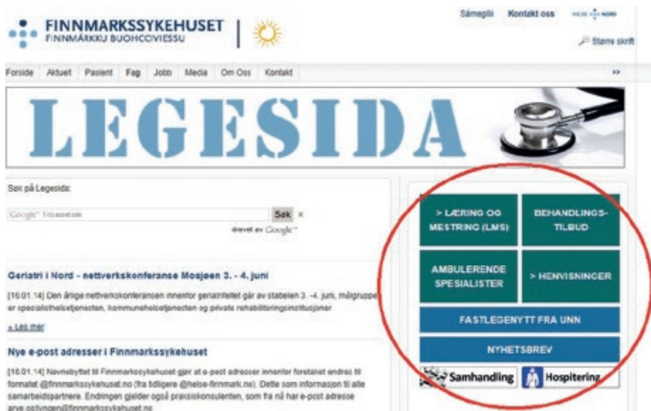
Forsiden av Legesida med knappemeny for hurtigvalg.

ambuleringsstedene Kirkenes, Hammerfest, Alta og Karasjok.