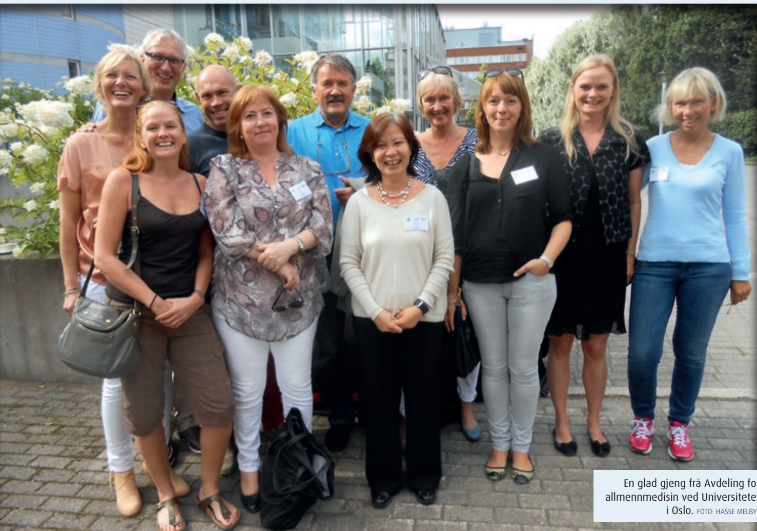
En glad gjeng frå Avdeling for allmenmedisin ved Universitetet i Oslo.

kongress, er det også kjekt å sjå seg litt om. Særleg når dei seine augustdagane kunne by på eit snev av «Indian summer». Tampere by er vel ikkje førsteval for nordmenn når vi skal velge reisemål for ein storbyweekend, men om du tilfeldigvis skulle hamne der likevel, så kan det vere verdt å merke seg at Tampere kan skilte med verdas aller siste Lenin-museum. Dette kan kanskje verke noko underleg, men historisk interesserte veit kanskje at Lenin budde i Tampere frå 1905 og to år fram-