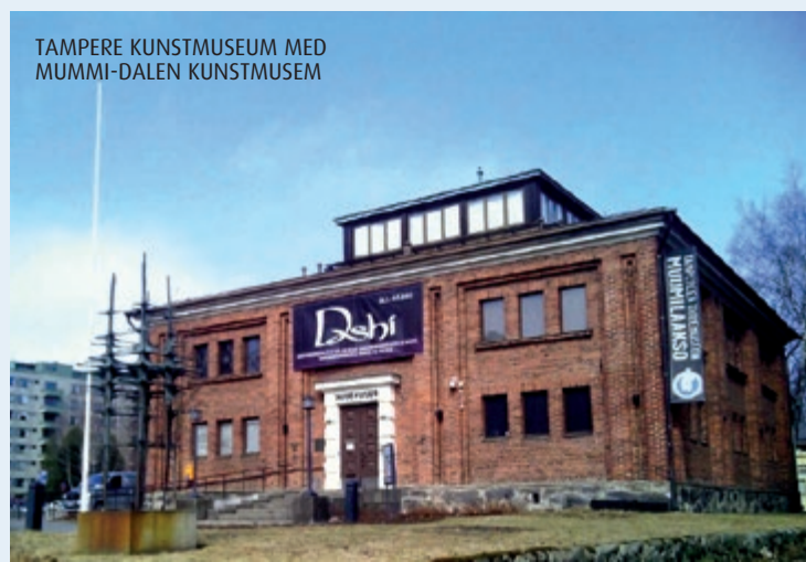
TAMPERE KUNSTMUSEUM MED MUMMI-DALEN KUNSTMUSEUM