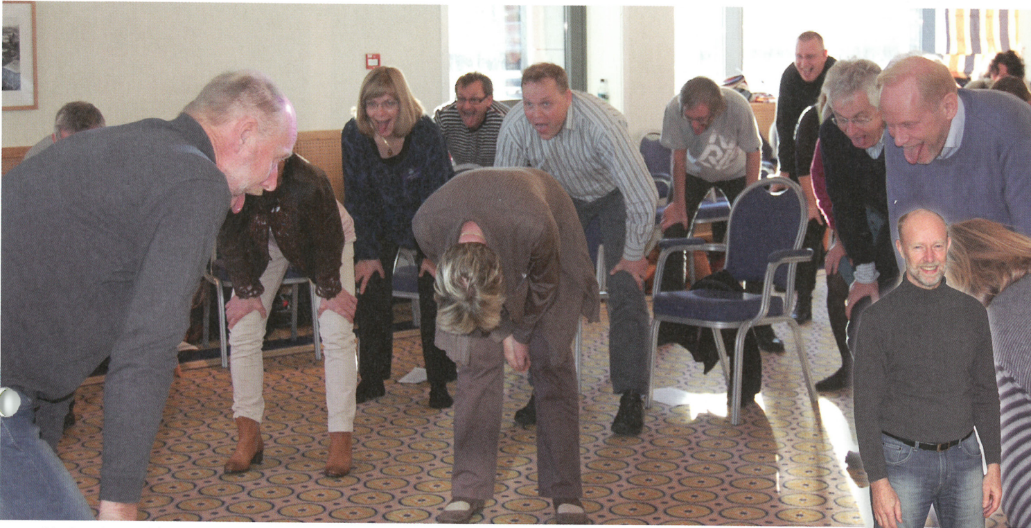
Det er ikke bare bare å delta på «Oppmerksomhetstrening – tunga kan fort «ramle ut».