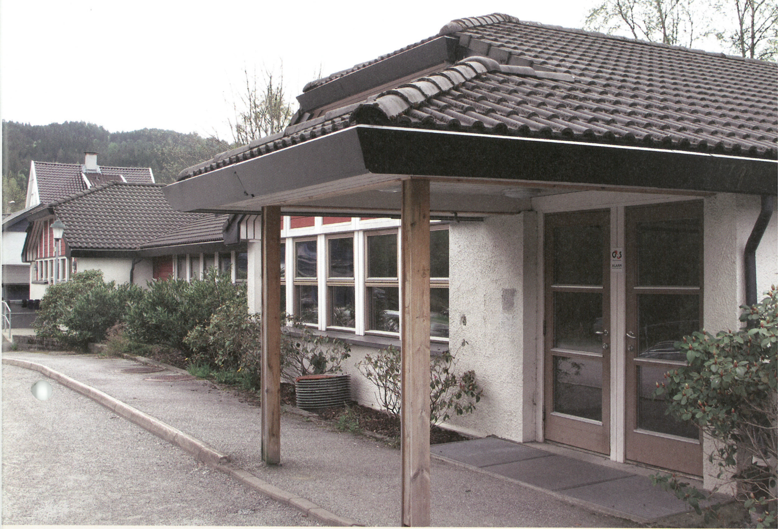
Fana legekontor er i dag en travel fire-legepraksis med turnuskandidat i tillegg. I lokalene holder også Fana helsestasjon til.

– Jeg tenkte ikke på det sånn. Det hadde ikke vært leger sør for Nesttun da, så jeg etablerte meg på jomfruelig grunn. Pasientpågangen var liten i starten, folk gikk ikke så mye til lege, men en del nysgjerrige piplet inn døren. En ringte og sa at nå når det har kommet leger i Fana, så kan vi begynne å gå til lege også, ler han hjertelig.