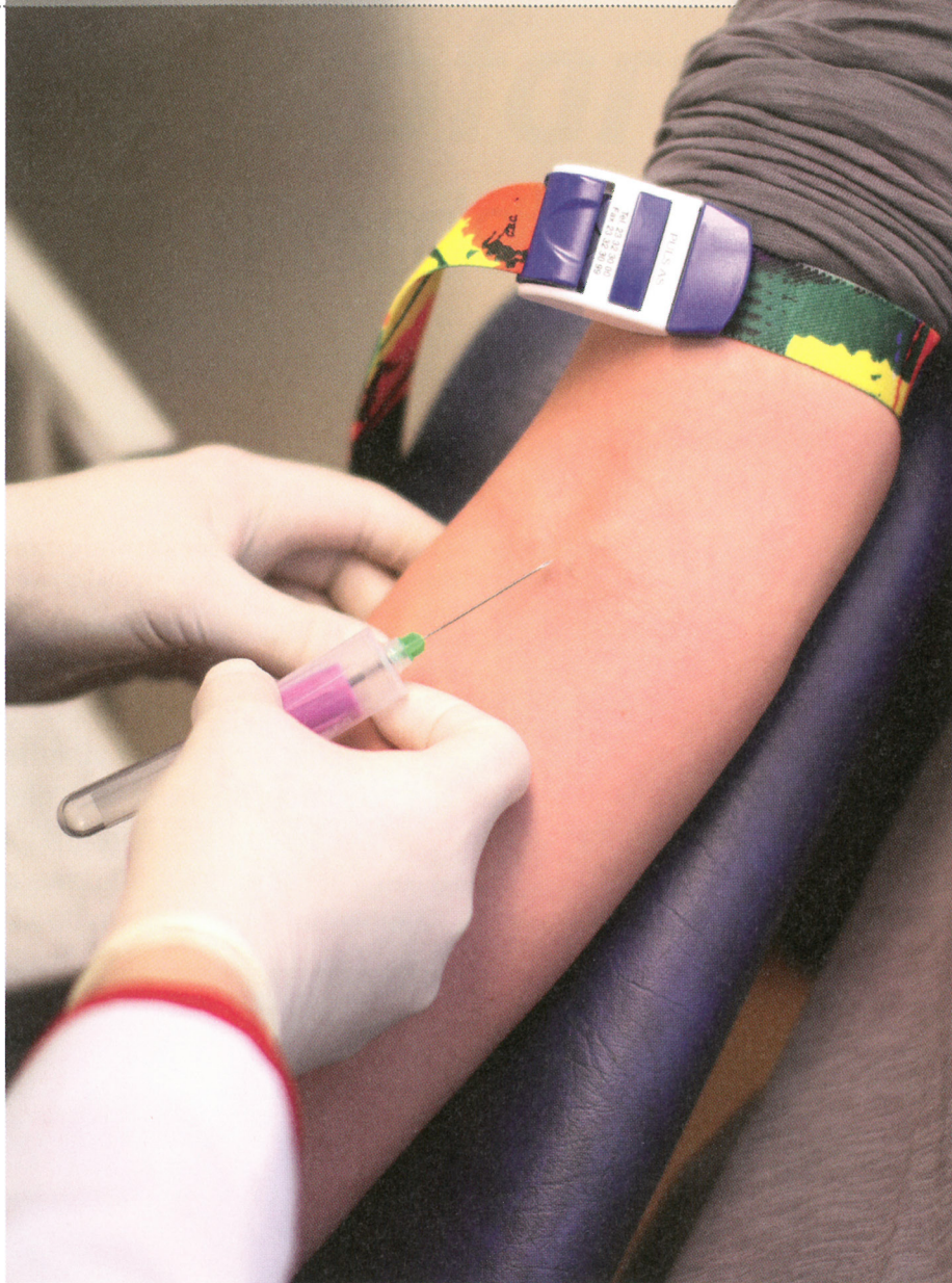
Blodprøver hører med til utredning av pasientene på PP.