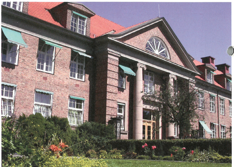
Diakonhjemmets psykofarmakologiske poliklinikk på Vinderen.

Psykofarmakologisk poliklinikk (PP) ble startet ved Senter for Psykofarmakologi ved Diakonhjemmet Sykehus i 2009. Målet med poliklinikken er å bidra til effektiv medikamentell behandling med færre bivirkninger og interaksjoner, samt unngå terapivikt. Det er et tverrfaglig tilbud med fokus på individuelt tilpasset behandling som kan bidra til en mer effektiv behandling. PP er et tilbud som kan gi bedre helse til enkeltpasienter. Videre vil det avlaste i en travel klinisk hverdag for allmennleger og psykiatere.