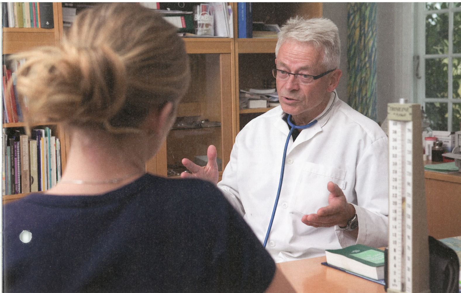
Gjennomgående skriver en fastlege omkring femten sykmeldinger i uken.

nettopp slitasje og belastning i arbeidssituasjonen, hvor en viktig del av behandlingen kan være avlastning fra dette. I andre tilfeller krever biologisk tilheling ro og hvile.