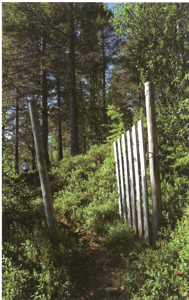
Fysisk aktivitet bedrer både funksjons- og mestringsevnen hos en rekke pasientgrupper, i første rekke dem med muskelskjelett-lidelser og psykiske plager.

Det er behov for økt kunnskap om fagområdet i grunnutdannelsen til helsepersonell, og det er behov for videreutdanningstilbud. I samarbeid med kompetansesenteret har Diakonhjemmet Høgskole etablert et tilbud om videreutdanning i ARR. Fagmiljøet trenger å utforske hvordan tilbudet faktisk ytes, hvilke komponenter som er i bruk, men også hvordan de kan sammenføres til et skreddersydd tilbud for den enkelte. Dette bør gjøres forskningsbasert.