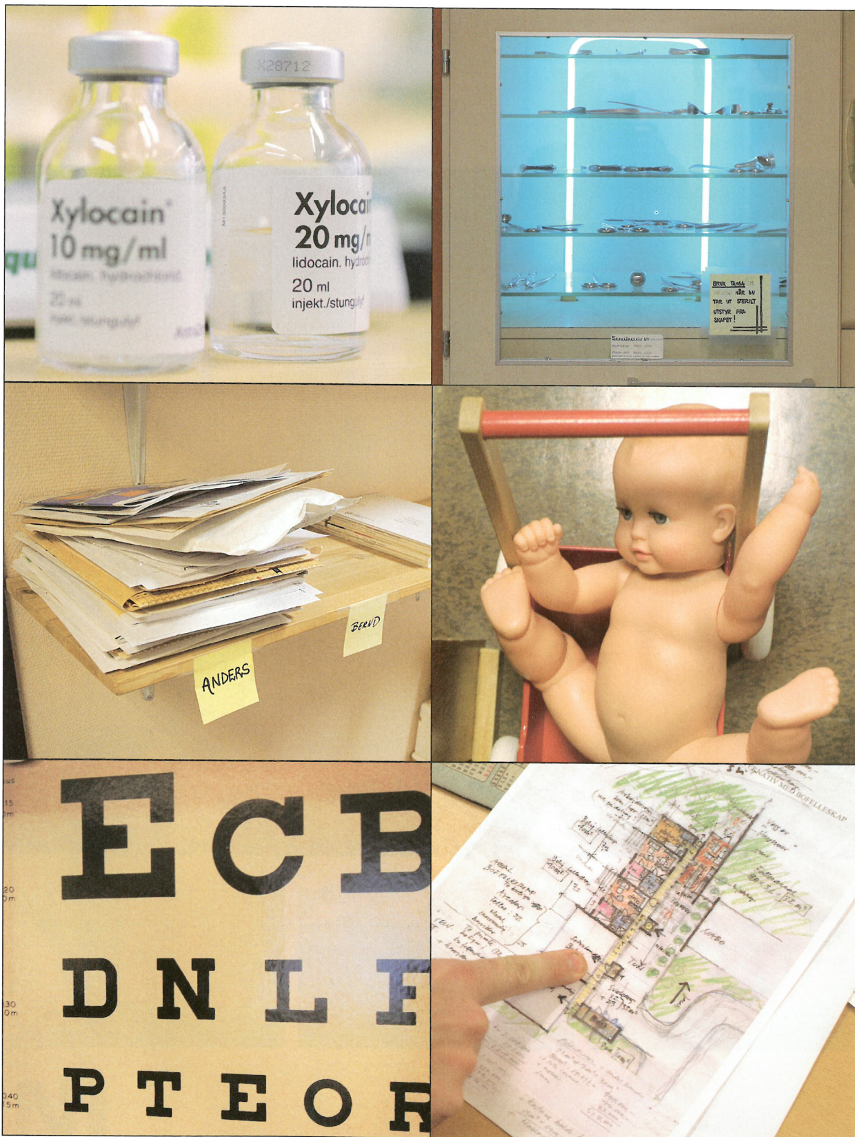
Som kommunelege arbeider du i samfunnet, i det lille samfunnet på legekontoret, i det større samfunnet i helse og sosialetaten og i det enda større, men likevel lille samfunnet i Bø i Vesterålen. De fleste som arbeider som kommuneleger er ikke spesialister i samfunnsmedisin, men vi blir etter hvert spesialister på det samfunnet vi bor i. Drivkraften er lojalitet.