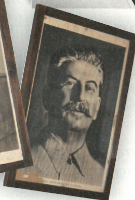
På partisan-sykehuset Franja var det politiske plakater og bilder av Tito og Stalin

sommeridyllen som ved første øyekast hadde minnet oss litt om norsk 50-tall ble tveetydig og uhyggelig. Alltid melder det samme spørsmålet seg. «Hva er da et menneske?»