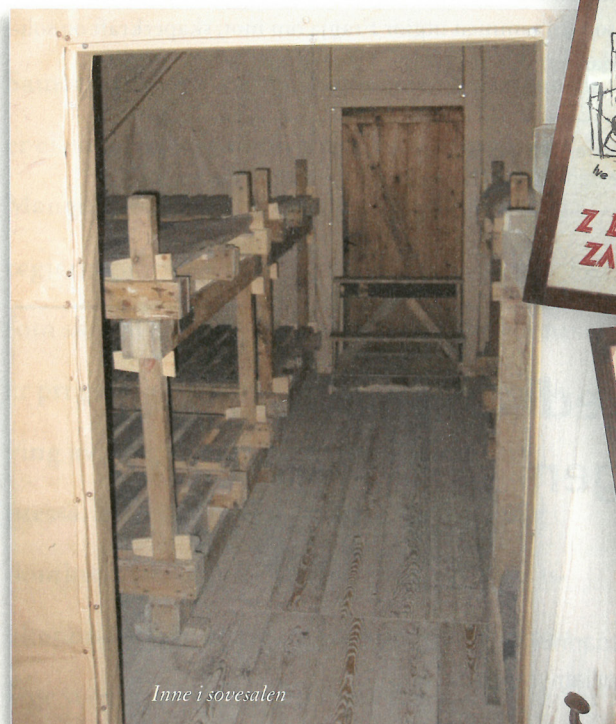
Inne i sovesalen