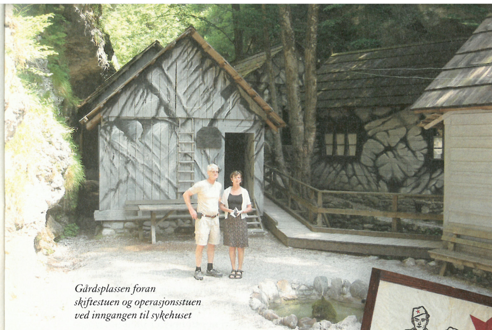
Gårdsplassen foran skiftestuen og operasjonsstuen ved inngangen til sykehuset